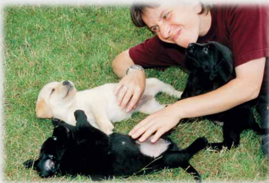
Die Aufrichtigkeit innerer Zuwendung des menschlichen Fürsorgegaranten und seine Feinfühligkeit im Erkennen und Erfüllen der natürlichen Bedürfnisse des Welpen ist die Grundlage für eine gelingende Verhaltens- und Wesensentwicklung.

Anhand des aufgezeigten Beispiels lässt sich schon bei erster grober Betrachtung feststellen, dass es dem Welpen möglich war, durch eigenes Tun etwas zu bewirken und dabei an-